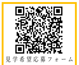
見学希望応募フォーム