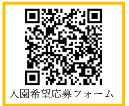
入園希望応募フォーム